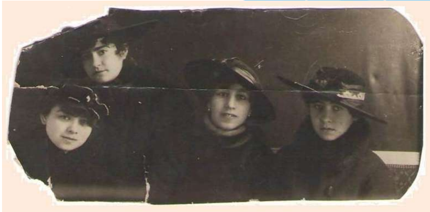
Bild aus der Buch der Bibliothek medizinisches Institut, medizinische Gesellschaft in Charkiw, wahrscheinlich StudentInnen 1910-1920