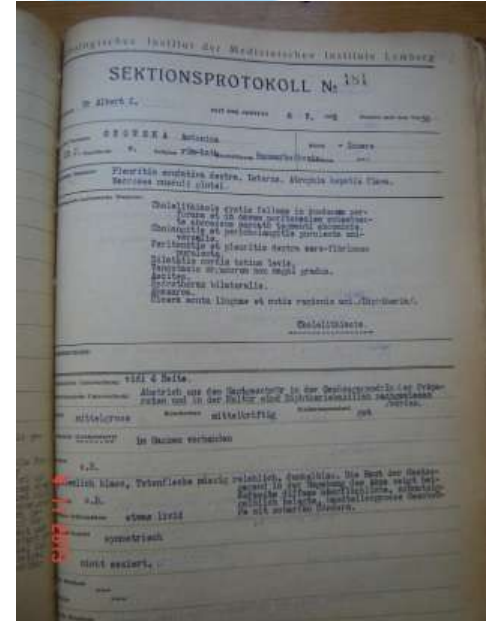
Probe erste Seite Abschnitt Protokoll 1911, 1941