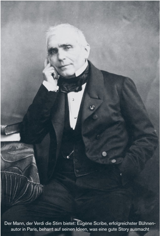
Der Mann, der Verdi die Stirn bietet: Eugène Scribe, erfolgreichster Bühnenautor in Paris, beharrt auf seinen Ideen, was eine gute Story ausmacht