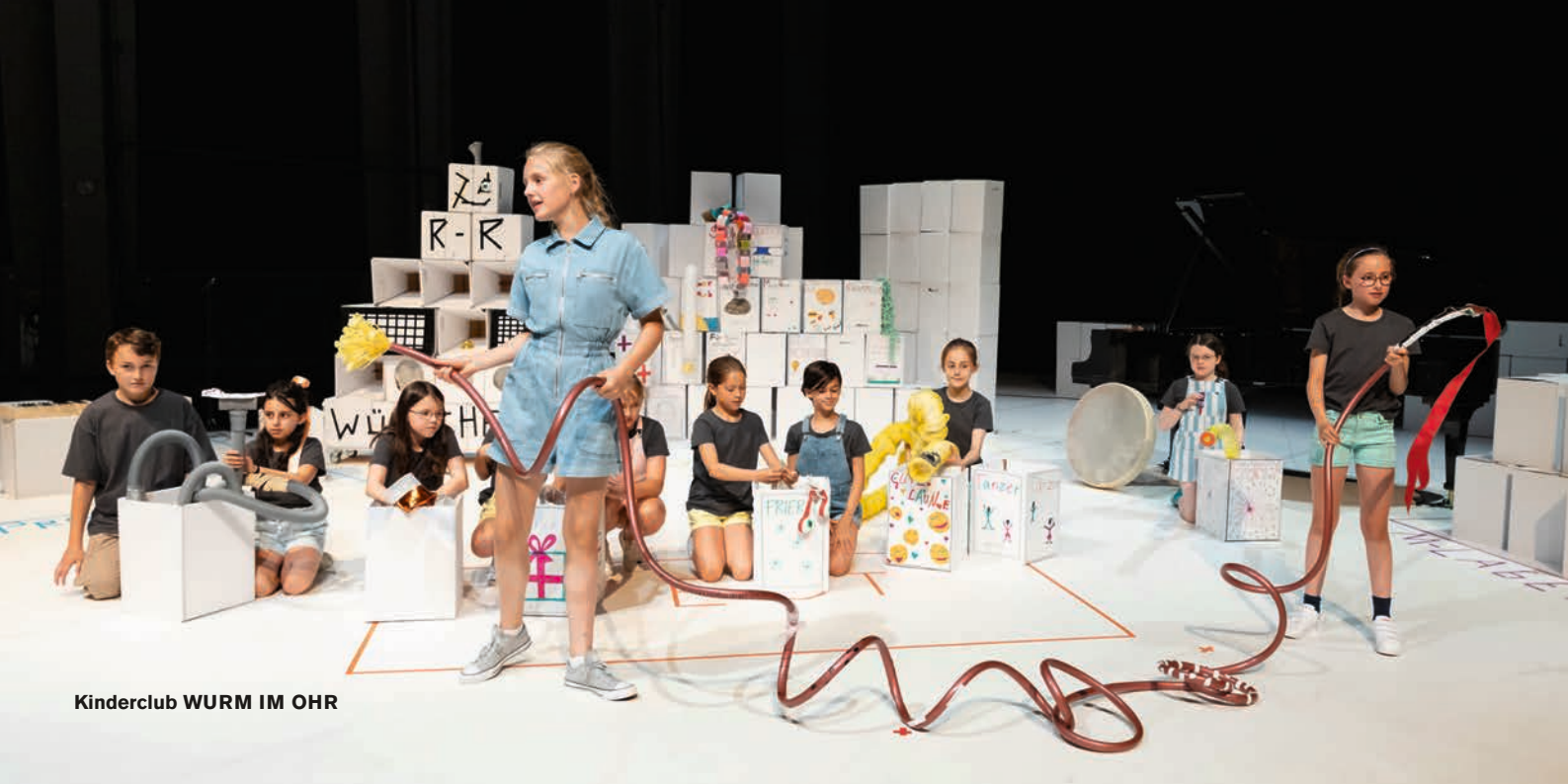
Kinderclub WURM IM OHR