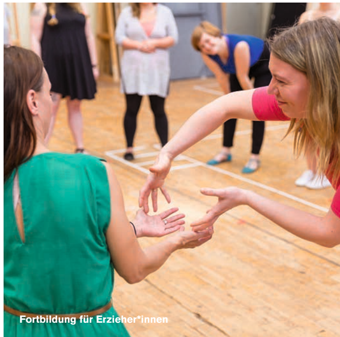
Fortbildung für Erzieher*innen

Wie wäre es mit einem Ausflug in die Oper mit Ihrem Team oder Kollegium? Wir gestalten Ihren Opernbesuch inklusive Einführung oder Workshop vorab als besonderes Erlebnis neben Ihrem Arbeitsalltag. Sie zahlen nur €8,- pro Lehrer*in oder Erzieher*in für den Eintritt. Termine können individuell vereinbart werden.