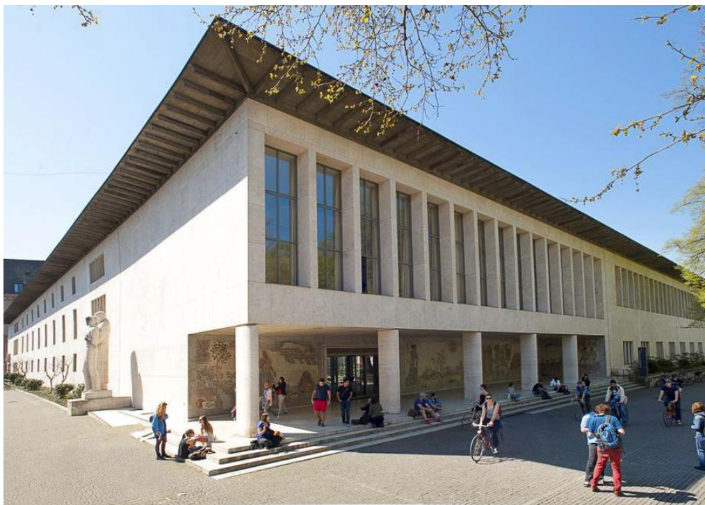
BIBLIOTHEKEN IM FLUSS