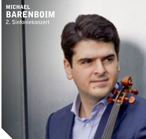
MICHAEL BARENBOIM 2. Sinfoniekonzert