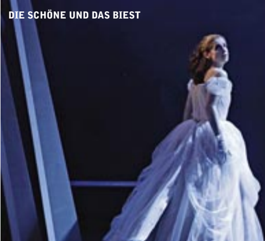
DIE SCHÖNE UND DAS BIEST