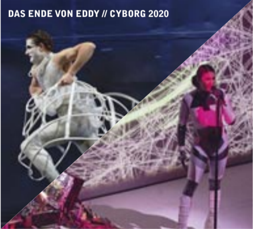
DAS ENDE VON EDDY // CYBORG 2020

Zusammen ergeben beide Abende eine komplexe Auseinandersetzung mit den Themen Befreiung von bestimmenden Konstruktionen, Geschlecht, Sexualität. Gesamtdauer: ca. 2 Stunden, 45 Minuten, Pause zwischen den Stücken.