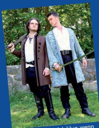
Wie verhält man sich klug, wenn man Lösegeld erpressen will?

Aus den schutzsuchenden Gästen werden schnell Gefangene und die Planungen für eine Lösegelderpressung laufen auf Hochtouren. Ein Teil der Gefangenen soll losgeschickt werden, um der reichen Herzogin von Pommern eine Nachricht zu überbringen: Ihre Enkelin Franziska werde nur freigelassen,