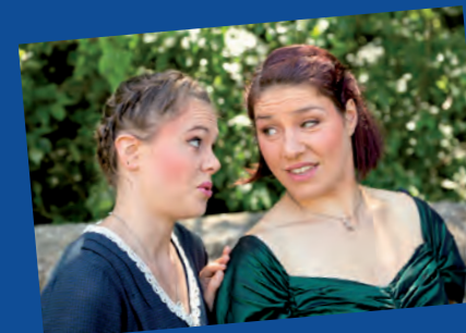
Hier werden keine Mädchen-Geheimnisse ausgetauscht, sondern handfeste Pläne geschmiedet, um sowohl die Großmutter, als auch die Piraten zu überlisten.

Doch der Captain der Seeräuber erkennt sie ... Erleben Sie das Barther Seeräuberstück als aufwändiges Sommerspektakel für die ganze Familie im BartherTheaterGarten. Ein räuberischer Spaß für Groß und Klein. Aber: Vorsicht vor den Seeräubern!