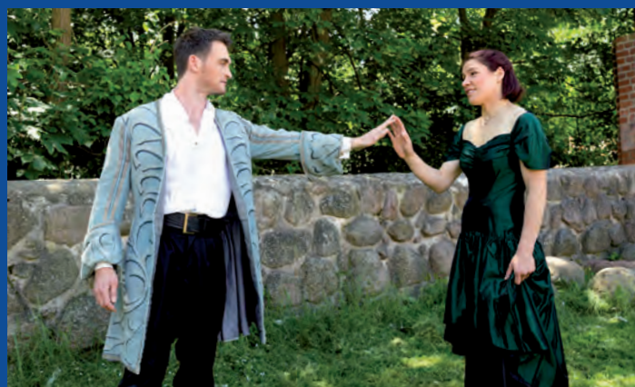
Ob es doch noch was wird? Mit der Schönen und dem Captain.